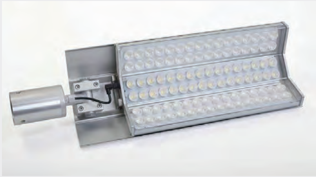
El. nr. 3508822