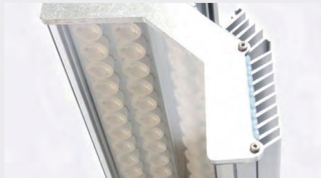
El. nr. 3508827