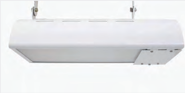
El. nr. 3508806