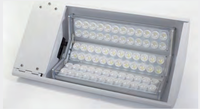
El. nr. 3508805